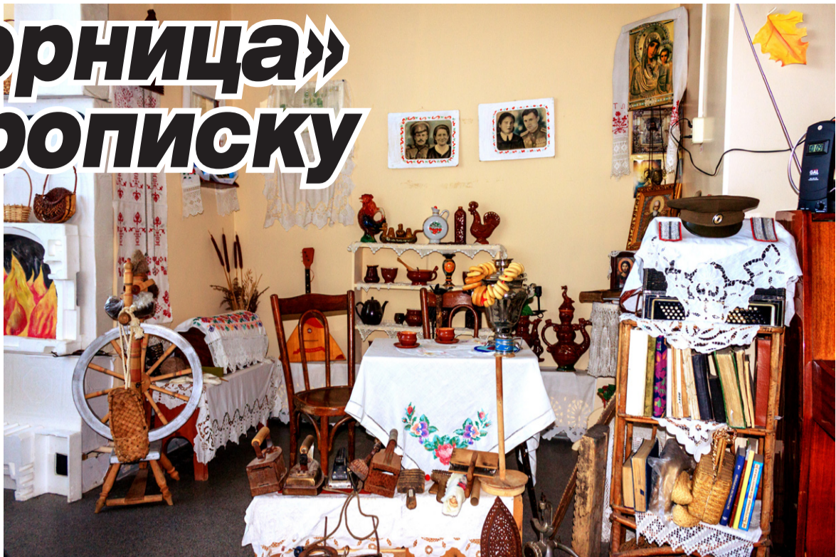
Такой «Казачья горница» была когда-то